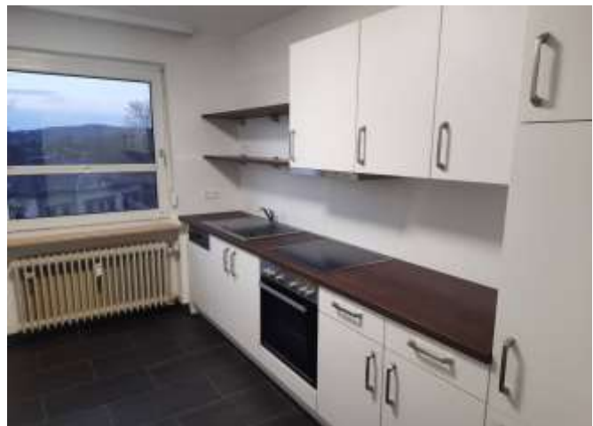
Energieverbrauchsausweis, 103,0 kWh/(m 2 a), Öl, Kl. D

Beschreibung: Die im 5. Obergeschoss eines Mehrparteienhauses befindliche Eigentumswohnung verfügt über einen schönen Grundriss, lichtdurchflutete Wohnräume und einen herrlichen Ausblick über Bayreuth.