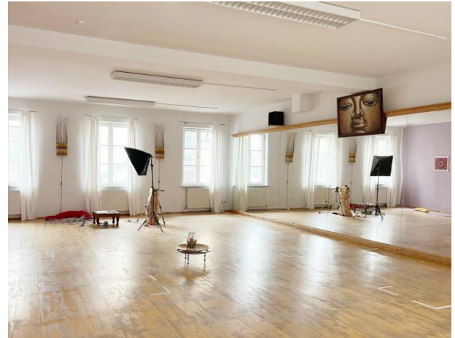
Energiebedarfsausweis, 176,1 kWh/(m 2 a), Gas

Beschreibung: Das Objekt befindet sich in zentrumsnaher Lage von Bayreuth. Zum Omnibusbahnhof, Hauptbahnhof, Rotmaincenter und ins Stadtzentrum sind es nur wenige Gehminuten.