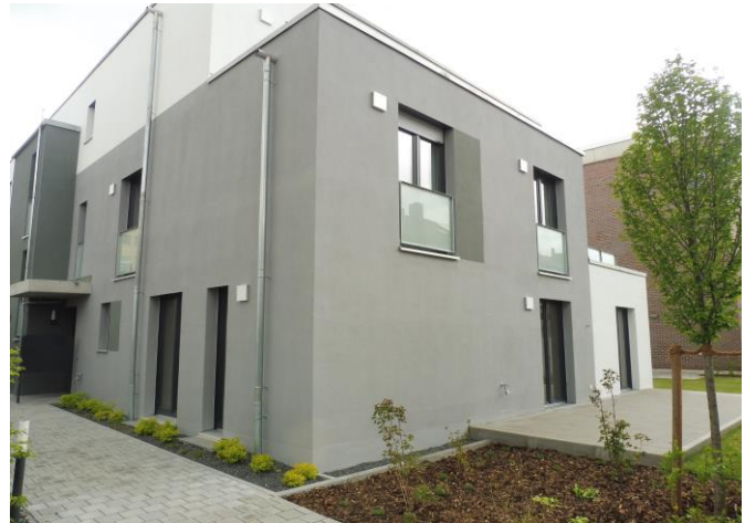
Energiebedarfsausweis, 23,2 kWh/(m 2 a), Erdgas, Kl. A+

Beschreibung: Das Haus beherbergt insgesamt nur 6 Eigentumswohnungen und besticht durch die persönliche Note der kleinen Hausgemeinschaft. Durch die klare Raumaufteilung, Tageslichtbäder und offene Wohn- und Essbereiche erhalten die einzelnen Wohnungen Struktur und Funktionalität. In jeder Wohneinheit holen bodentiefe Fensterflächen das Außen nach Innen und geben den Räumen Weite und Helligkeit.