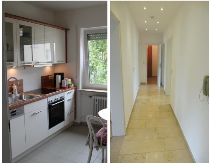
Energieausweis in Bearbeitung

Beschreibung: Die zentral gelegene Eigentumswohnung befindet sich im 2. Obergeschoss einer gepflegten Wohnanlage nur wenigen Gehminuten vom berühmten Bamberger Dom und dem Stadtzentrum entfernt.